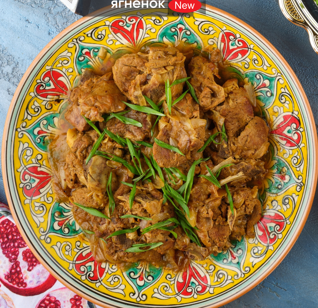
Бухарский ★ ягнёнок New