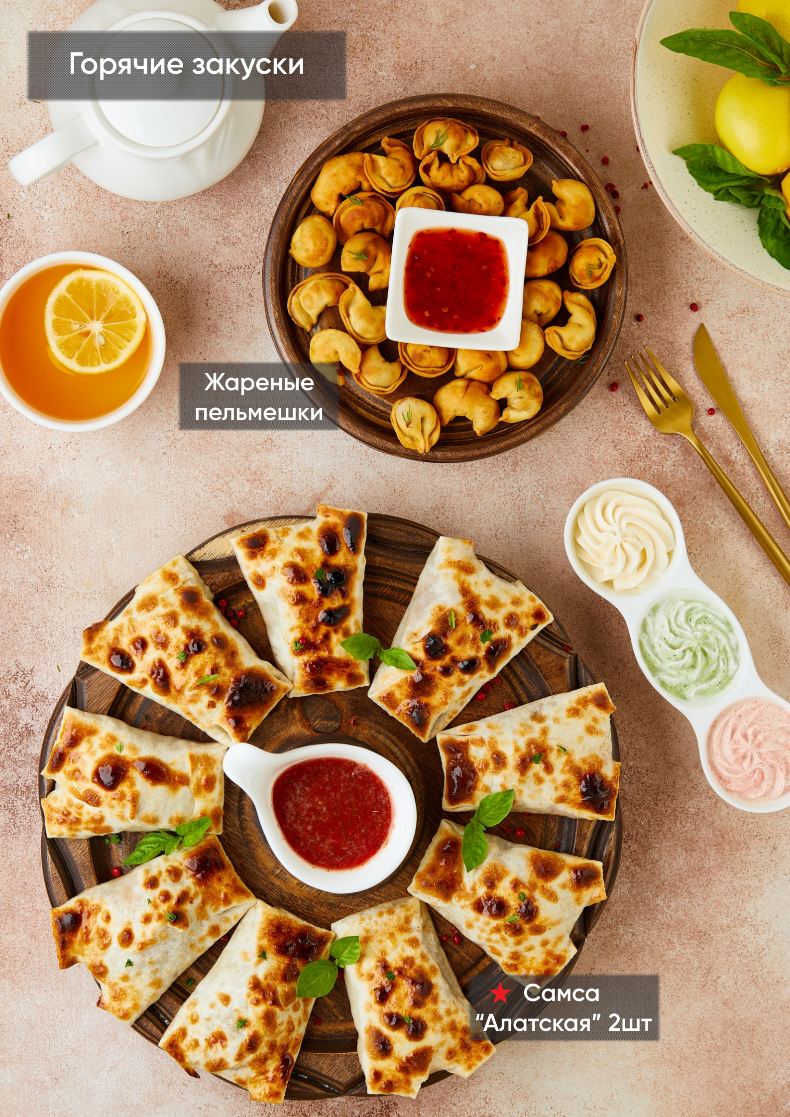
★ Самса "Алатская" 2шт