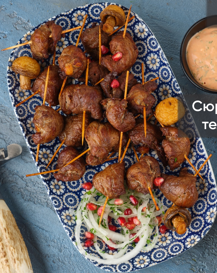
Сюрприз из ★ телятины New